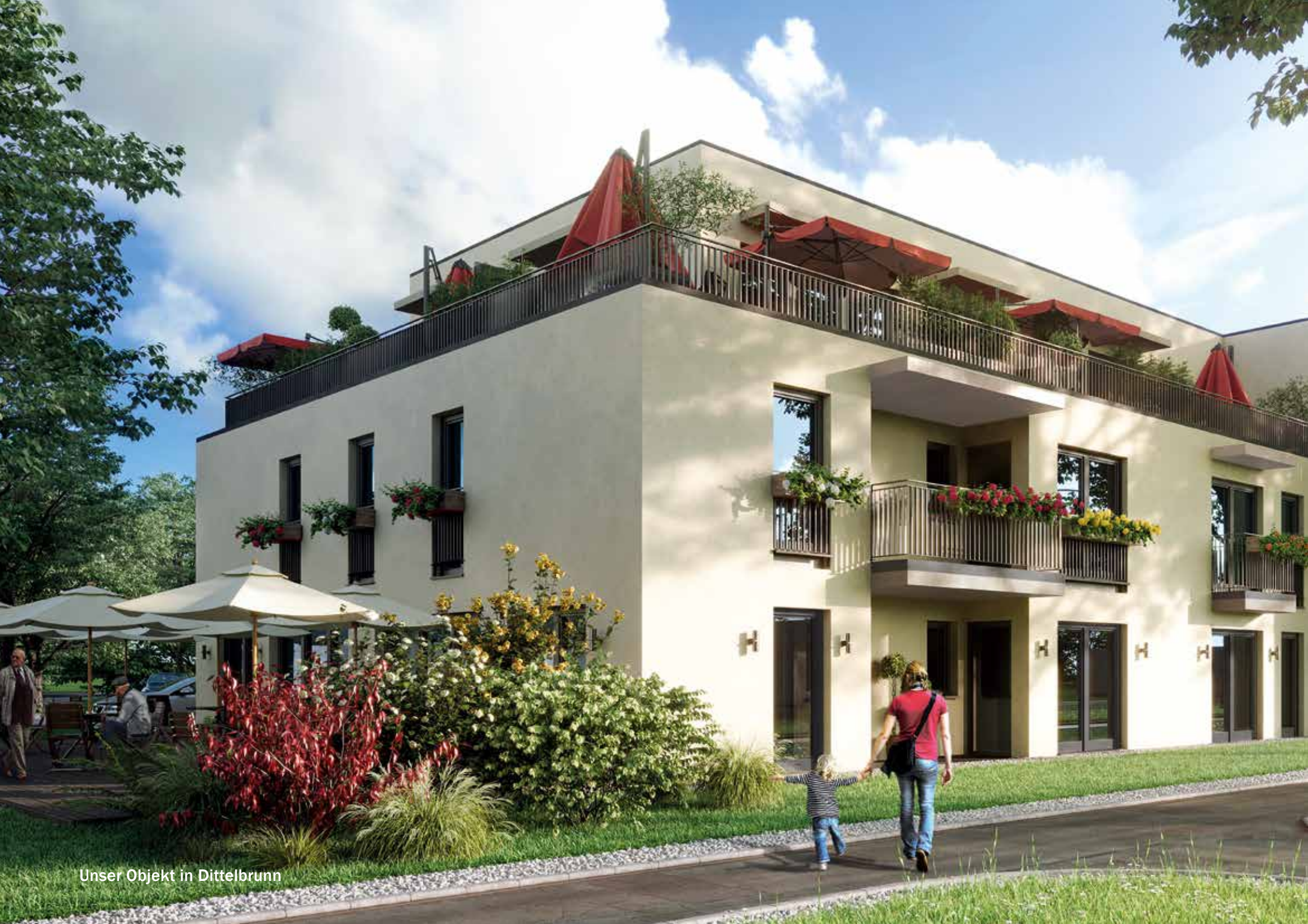
Unser Objekt in Dittelbrunn