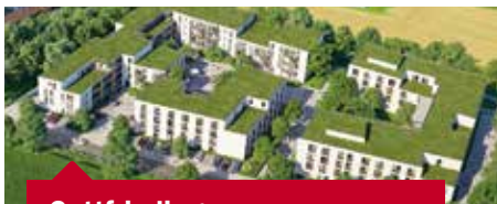
Gottfrieding – im Bau

94469 Deggendorf Hauptstraße, Ortsteil Fischerdorf 280 Appartements