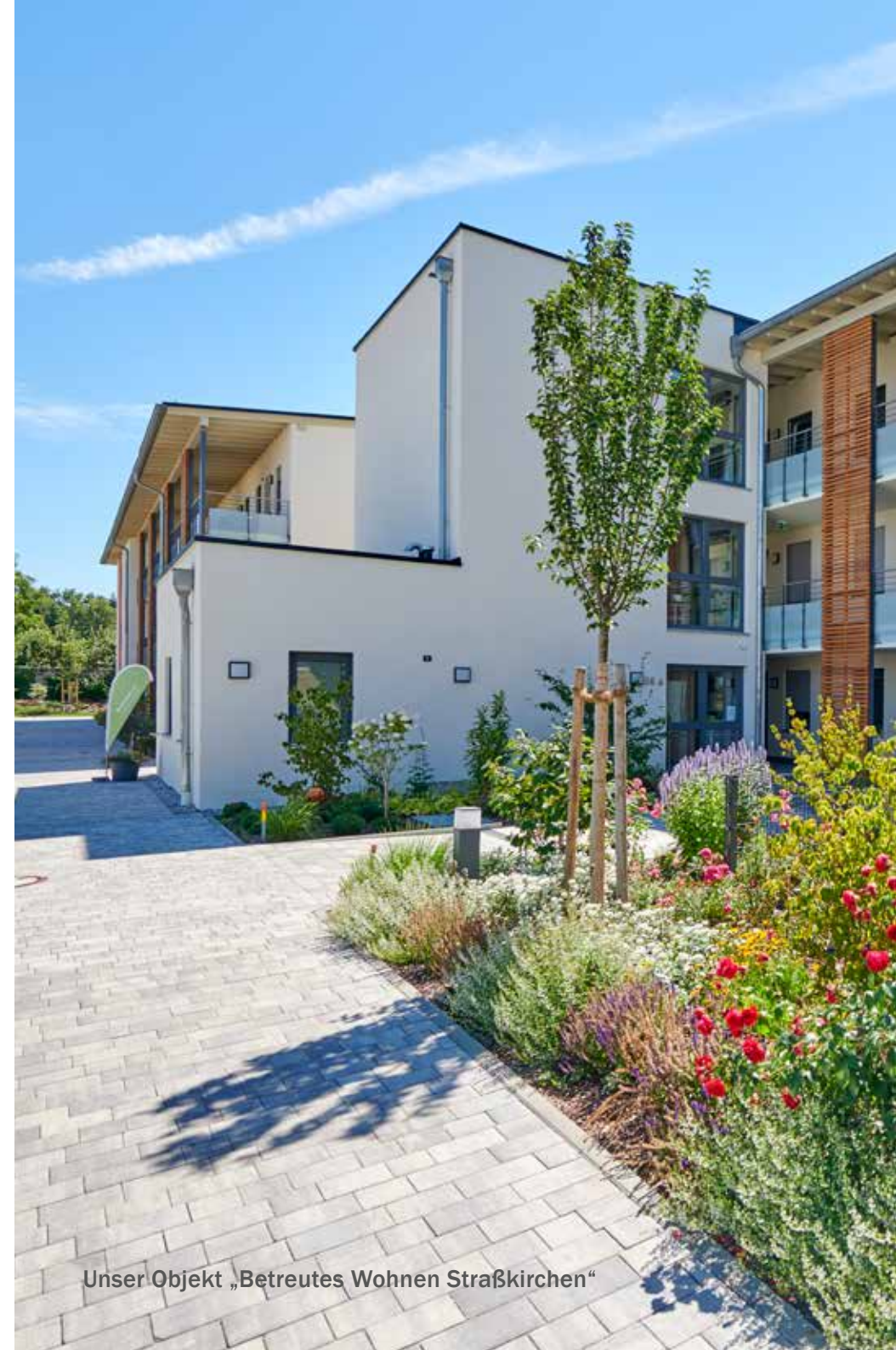
Unser Objekt „Betreutes Wohnen Straßkirchen“

94577 Winzer Passauer Str. 77a Betriebsträger: BRK Kreisverband Deggendorf 48 Pflegeplätze Grundstücksverkäufer: Markt