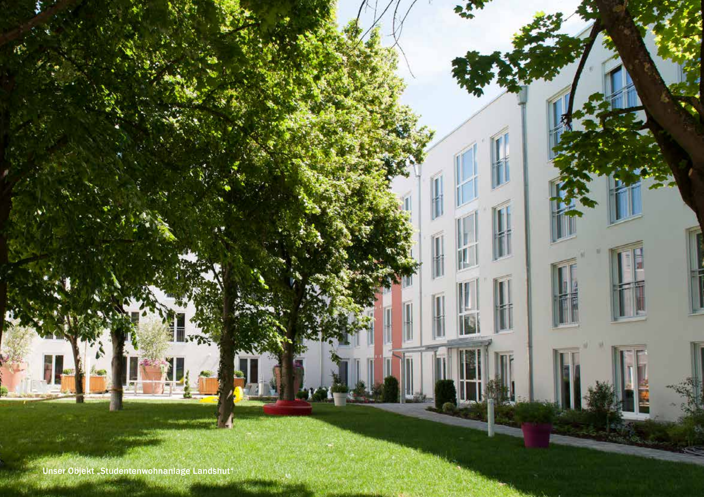
Unser Objekt „Studentenwohnanlage Landshut“