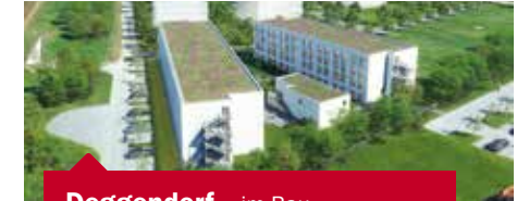
Deggendorf – im Bau

Bauabschnitt III 94469 Deggendorf Güterstr. 6 36 Appartements Grundstücksverkäufer: Stadt