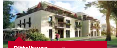
Dittelbrunn – im Bau